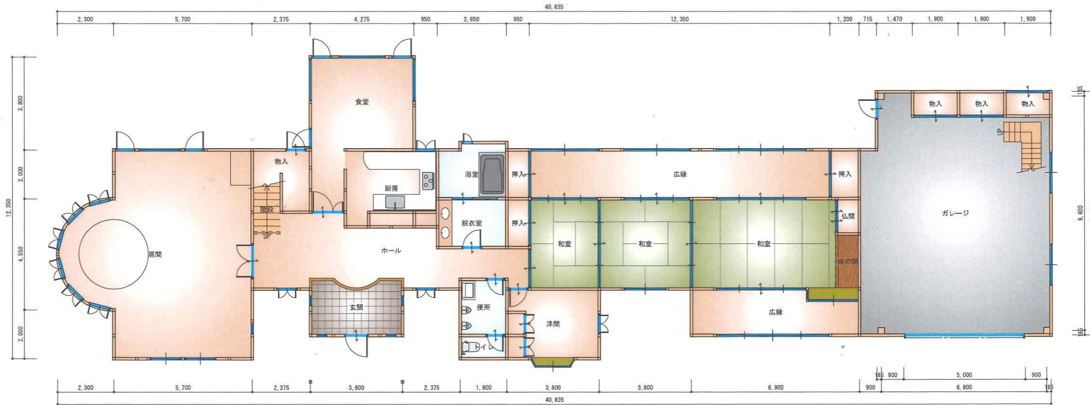
1階 平面図 S:1/150